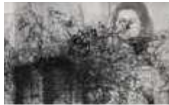
En suivant la main droite de - Sophia Lauren dans "La Ciociara", 2009. 162 x 254 cm.