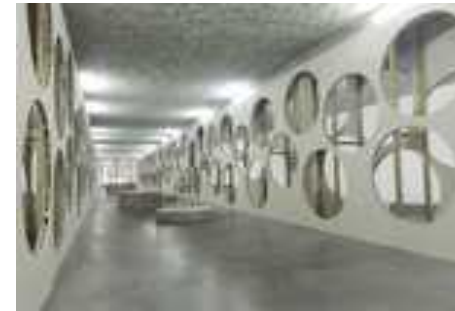
Quelque chose en moins, quelque chose en plus, 2014. Cloisons de plâtre trouées et bois, format variable. Production MRAC. Courtesy de l'artiste.

Lors de son exposition personnelle au centre d'art de Brétigny en 2003, Pierre Bismuth avait besoin d'éliminer une cimaise installée par l'institution. En prenant pour prétexte de la transformer en œuvre d'art, il fit ouvrir la cimaise d'un trou le plus large possible et fit garder le disque découpé au sol. Fidèle à sa maxime selon laquelle « le problème est la solution », il transforme alors la contrainte en possibilité. Le stratagème est depuis devenu une œuvre à part entière qui s'est développée sur différents supports. Le principe est à chaque fois identique : un support est évidé par un maximum de trous sur sa surface de manière aléatoire sans risquer de mettre à mal sa stabilité structurelle.