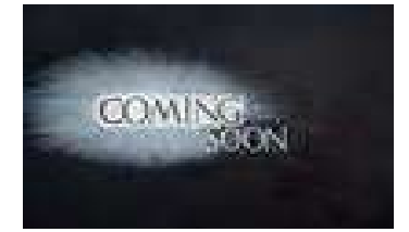
Coming Soon (Ray of Light), 2008. Huile sur toile, 138 x 180 cm.