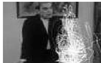
En suivant la main gauche de - Jacques Lacan dans "L'âme et l'inconscient", 2012. Vidéo sur moniteur, noir et blanc, son, 5 min. Courtesy galerie Jan Mot, Bruxelles.