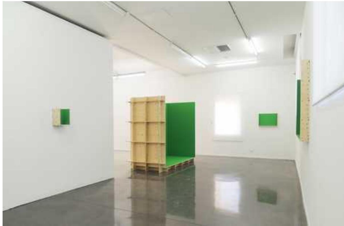
Cyclo, 2014. Chroma Key Green sur bois, 6 sculptures, différents formats. Production MRAC.

La toute nouvelle série « Cyclo », initiée pour cette exposition, consiste en une série de caissons en bois ouverts, dont l'intérieur est peint dans une qualité de vert particulièrement lumineux : le « Chroma Key ». Directement inspirées des studios dits d'incrustation, à la télévision et au cinéma, ces constructions présentent un espace intérieur sur lequel, par la magie du digital, vient normalement s'incruster des univers et des décors dépassant largement les limites de l'espace circonscrit par ces « boîtes ». Ici, l'espace du studio a été volontairement ramené à l'échelle d'œuvres d'art minimales, plaçant le public dans la position inhabituelle de devoir regarder un objet initialement conçu pour précisément ne pas être vu. En l'absence de toute incrustation, elles deviennent des supports de projections mentales pour les visiteurs / spectateurs / acteurs.