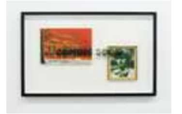
Coming soon - Nouvelle série #1, Coming soon - Nouvelle série #2, Coming soon - Nouvelle série #3, 2014.