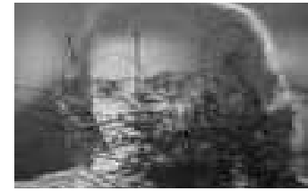
En suivant la main droite de - Ingrid Bergman dans "Casablanca", 2005. 100 x 130 cm. Courtesy de la galerie Bugada & Cargnel, Paris.