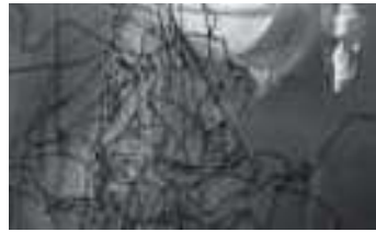
En suivant la main droite de - Anita Ekberg dans "La Dolce Vita", 2008. 58 x 104 cm.