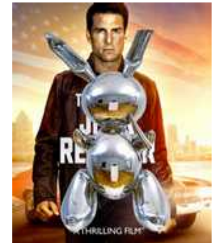
Biopic - Jeff Koons, 2014. Poster marouflé sur métal, 190 x 135 x 0,5 cm. Production MRAC. Courtesy de l'artiste.

Dans « Biopic », une série créée à l'occasion de l'exposition, Pierre Bismuth produit des affiches de films imaginaires faisant se rencontrer les univers du cinéma et de l'art contemporain. Des acteurs célèbres sont choisis pour interpréter des artistes renommés dont ils sont les contemporains, avec par exemple Tom Cruise pour incarner Jeff Koons. La synchronicité, appliquée par Pierre Bismuth à ces deux mondes, est un concept emprunté au psychanalyste Carl Gustav Jung. Il désigne l'occurrence simultanée d'au moins deux événements qui ne présentent pas de lien de causalité, mais dont l'association prend un sens pour la personne qui les perçoit. Ici, c'est la mise en concurrence des régimes de notoriété des deux arts qui intéresse Pierre Bismuth. Le résultat est à la fois plausible et improbable.