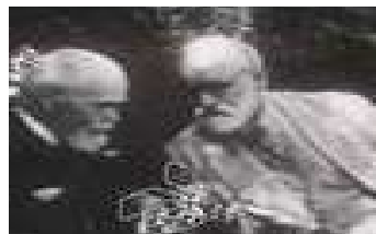
En suivant la main droite de Sigmund Freud, 2009. Projection DVD, 2 min. 37 sec.