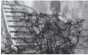
En suivant la main droite de - Claudia Cardinale dans "La Ragazza con la Valigia", 2008. Marqueur indélébile sur plexiglas anti-UV et impression lambda sur forex, 60 x 104 cm.