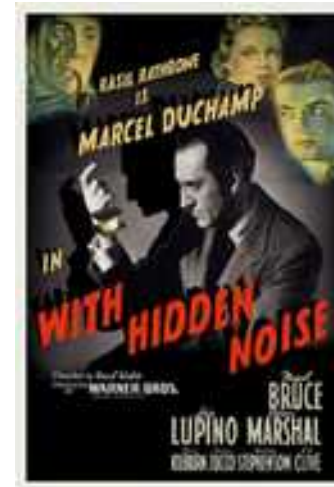
Biopic - Marcel Duchamp, 2014. Poster marouflé sur métal, 190 x 135 x 0,5 cm. Production MRAC. Courtesy de l'artiste.