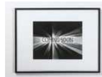
Coming Soon -#1, Coming Soon -#2, Coming Soon -#4, 2011. Dessin au fusain, 61,5 x 81 cm.