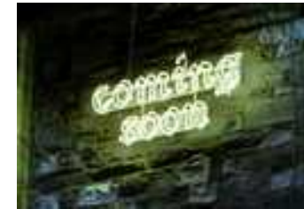
Coming Soon, 2010. Néon, 150 x 74 cm.