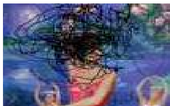
En suivant la main droite de - Cyd Charisse dans "The Band Wagon", 2008. 80 x 104 cm.