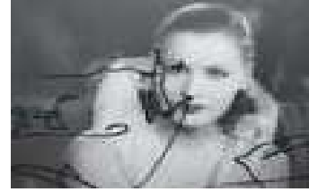
En suivant la main droite de - Greta Garbo dans "Flesh and the Devil", 2008. 114 x 153 cm. Courtesy de la galerie Bugada & Cargnel, Paris.