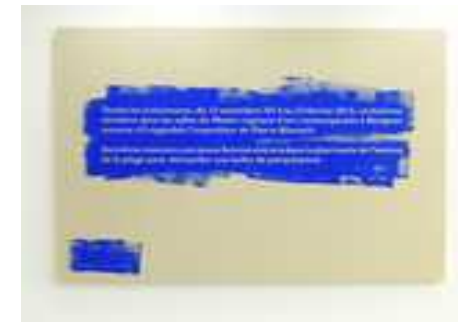
Performance n°14, 2014. Huile sur toile, 55 x 40 cm.